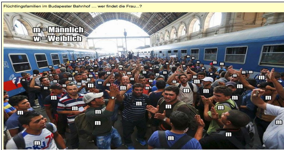
Wer findet die Frau?

Über 90% der Einwanderer sind Männer. Wieso bitte sind diese, wenn doch in ihren Ländern Krieg herrscht, nicht an der Front, um ihr Land zu verteidigen? Warum lassen sie ihre Frauen und Kinder im Stich? Warum bauen sie ihr Land nicht wieder auf, so wie es die Deutschen nach 1945 getan haben, was angesichts von Horden von "Facharbeitern" kein Problem sein dürfte. Wenn wehrfähige Männer aus einem Kriegsgebiet in andere Länder reisen, nennt man sie normalerweise Deserteure. Macht nichts, denn ein erstes Kontingent von Bundeswehrsoldaten soll laut Beschluß des Bundestages in Übergangung eines fehlen UN-Mandats und gegen den Willen der syrischen Regierung in Syrien kämpfen, während die echten und vermeintlichen Migrantensyrer hier eine ruhige Kugel schieben. Jeder betroffene Soldat sollte sich daher überlegen, ob er gegen Völkerrecht und Gewissen sein Leben oder seine Gesundheit riskiert.